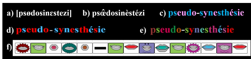
Figure 4 : Différentes approches pour représenter la prononciation (ici du mot "pseudo-synesthésie") : a) en alphabet phonétique international, b) en Alfonic, c) selon Borel Maisonnay, d) selon l'approche ÉcriLu (colorisation générée avec Wikicolor http://wikicolor.alem-app.fr/ ), e) en Silent Way (colorisation également générée avec Wikicolor) et f) avec les bouches utilisées par Do (représentation générée avec PhonoDrop http://phonodrop.alem-app.fr/ )